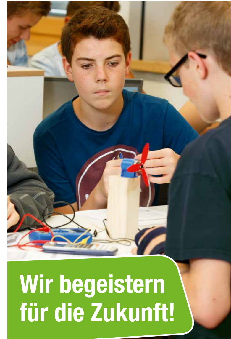
Stand: 4.2018, Fotos: IJF, Andreas Grasser